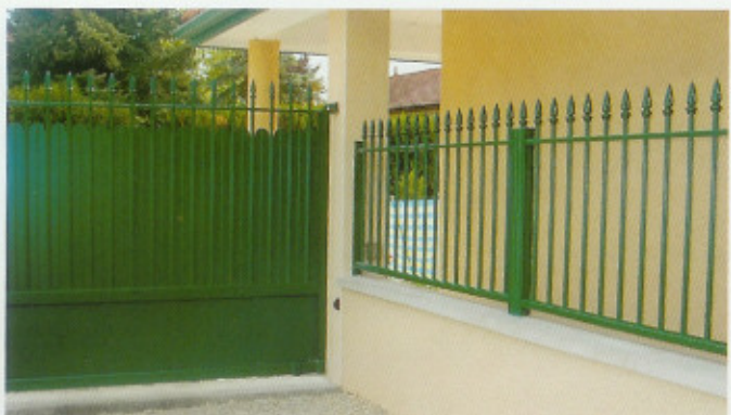
Kernera, pics flamme

Les modèles Tradition ont un barreaudage cannelé comme les portails Tradition. Ces modèles peuvent être ornés de pics en "fleur de lys" ("flamme" en option) ou bien recevoir un festonnage.