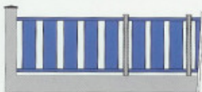
CHAMBORD B100 Barreaux 100 x 22 mm