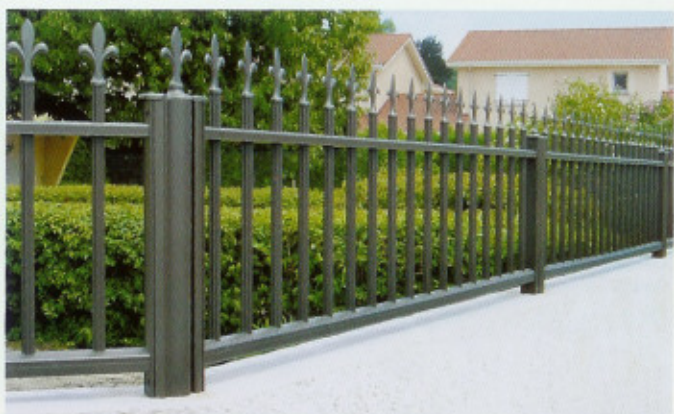
Kernera, pics fleur de lys

Les modèles Contemporain sont équipés soit de barreaux verticaux de différentes largeurs, soit de barreaudages horizontaux. Les modèles pleins sont en tôle ou en lames aluminium.