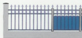
MYOSOTIS (avec ou sans festonnage)