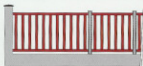
CHAMBORD B25 Barreaux 25 x 22 mm