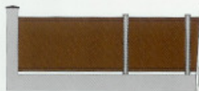
CHAMBORD DT Plein tôle aluminium